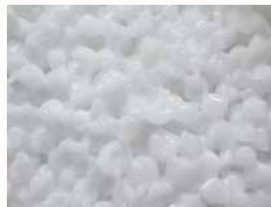
粒同士が吸湿して固まった状態